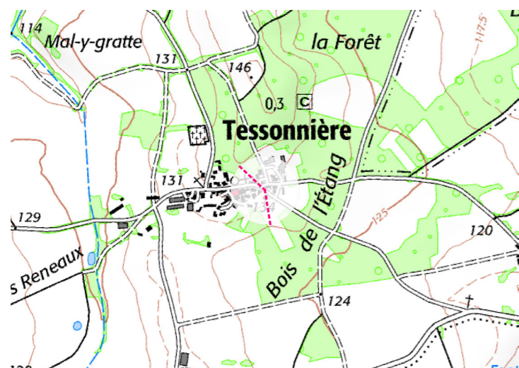
Localisation de la prise de vue

Enjeux : Depuis l'entrée est du bourg de Tessonnière, les éoliennes du projet se dessinent à l'arrière des végétaux d'ornement des jardins et des boisements ceinturant une partie du village. De ce fait, le motif est filtré et les éoliennes ne sont pas visibles dans leur intégralité. Les aérogénérateurs se superposent, brouillant légèrement le motif. On ne note pas de phénomène de rupture d'échelle car tous les éléments présents aux premiers et moyens plans sont de taille apparente plus élevée que les aérogénérateurs.